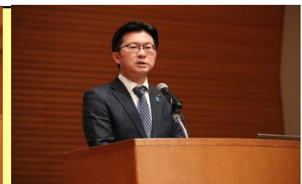
米子市長 伊木 隆司 氏