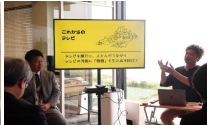
現地視察 株式会社アマゾンラテルナ 鳥取大山オフィス