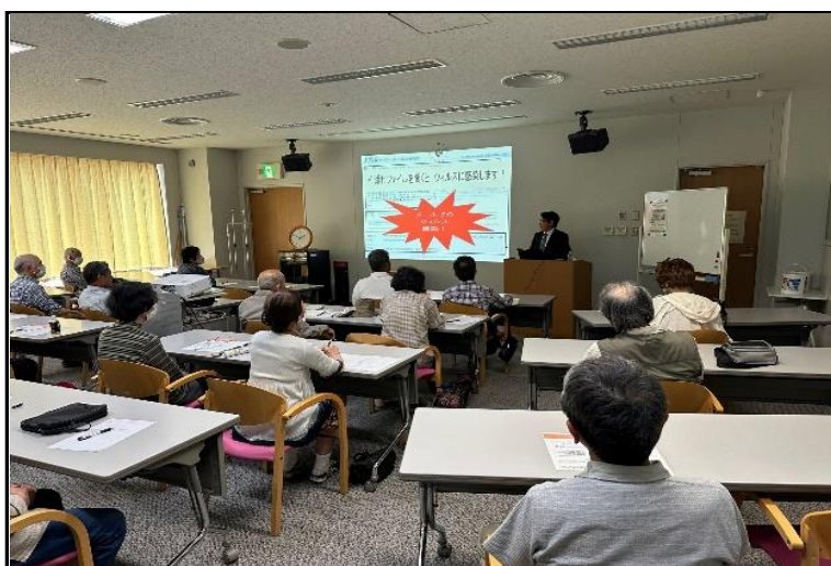
高齢者を対象にした公開講座の様子 会場はほぼ満員となった