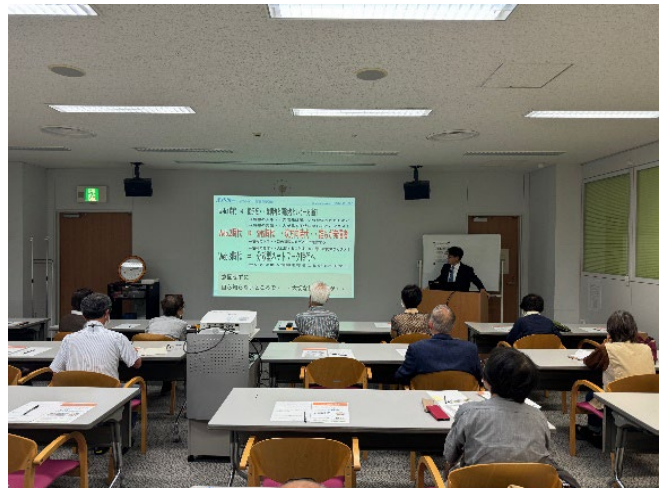
次世代インターネットについて