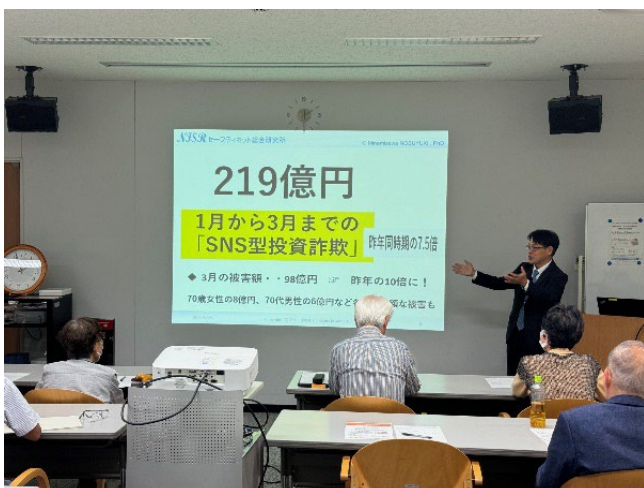
SNS投資詐欺について