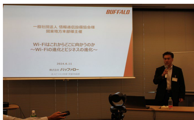
(株)バッファローの講演風景