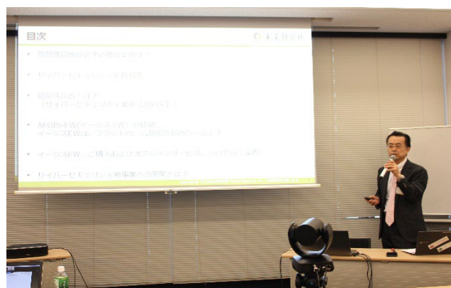
(株)未来研究所の講演風景